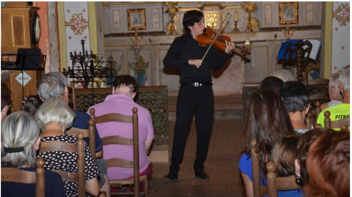
• Un concert de grande qualité.