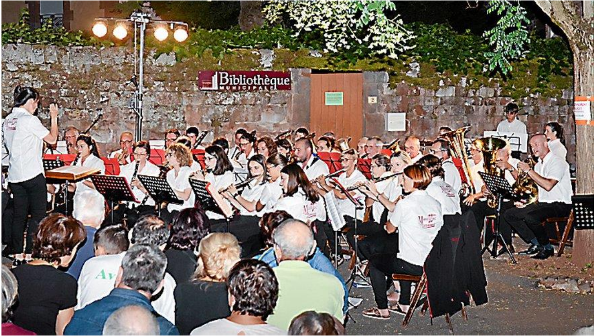
• Place des pénitents, vendredi 5 août.