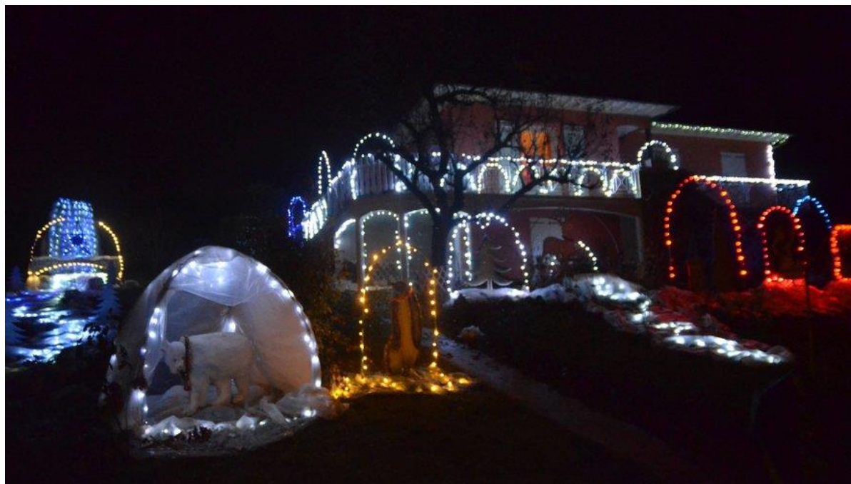
La maison Cabrol a revêtu ses habits de lumière.