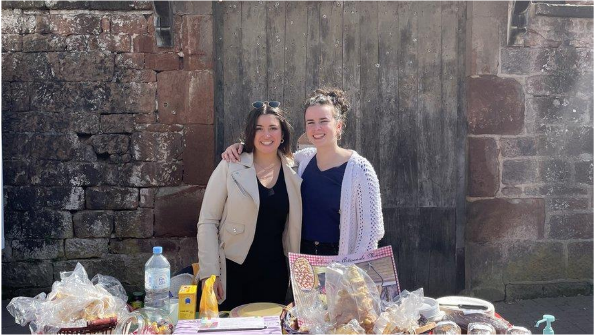
• Les deux jeunes filles tiendront un stand dimanche au marché.