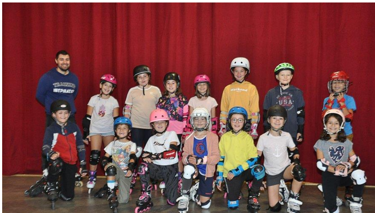
• Une trentaine d'enfants fidèles aux séances hebdomadaires.