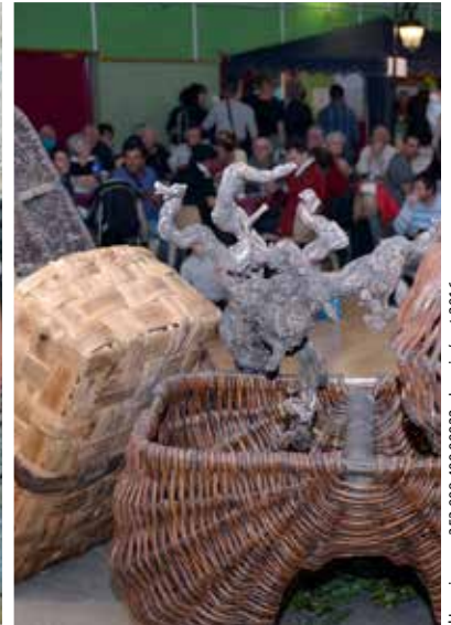
Mise en page phestudio - Impression Herall Imprimeurs 353 009 400 00022 - Imprim'vert 2016