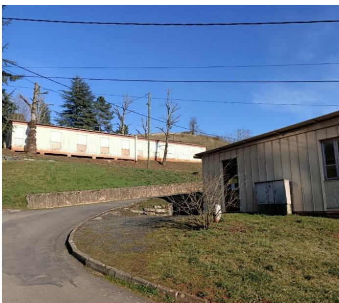
Vue sur 2 préfabriqués existants