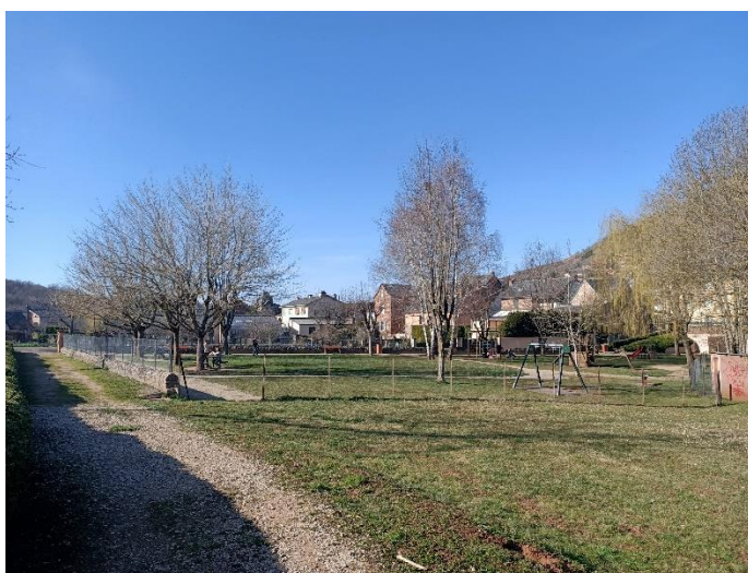
Vue vers l'école maternelle et le petit parc existant