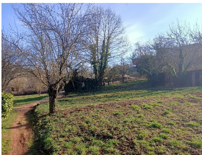
Vue du terrain vierge et en direction du terrain à bosses et du lotissement du Puech