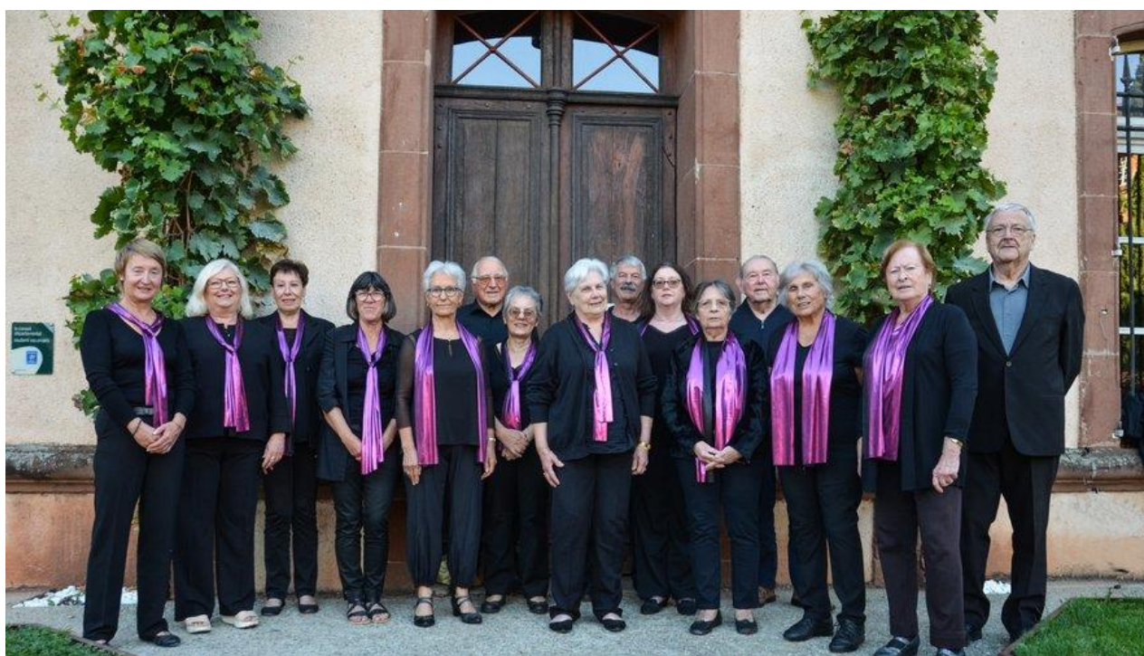
• De véritables moments de plaisir à partager autour du chant.