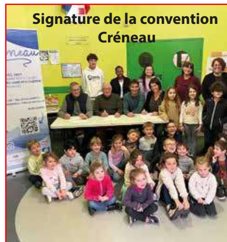
Signature de la convention Créneau