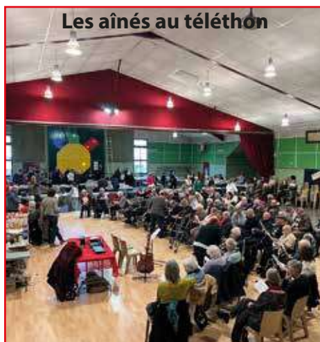
Les aînés au téléthon