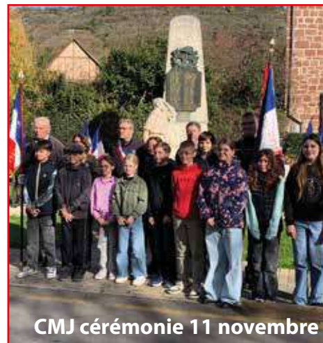
CMJ cérémonie 11 novembre