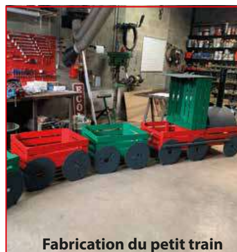
Fabrication du petit train