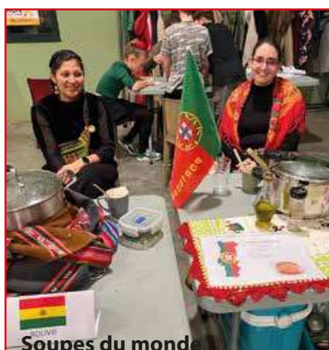
Soupes du monde