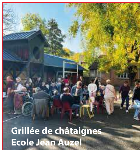
Grillée de châtaignes Ecole Jean Auzel