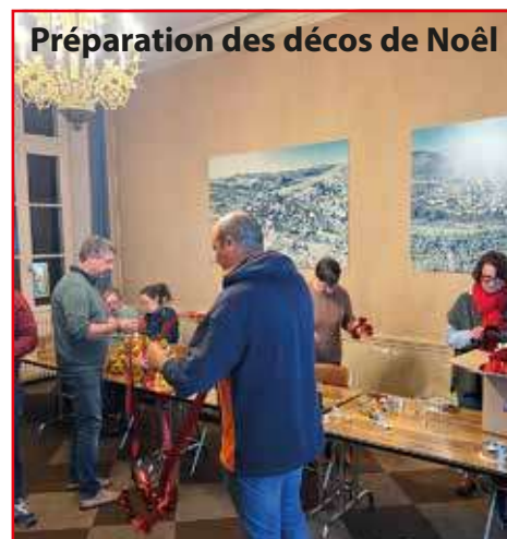
Préparation des décors de Noël