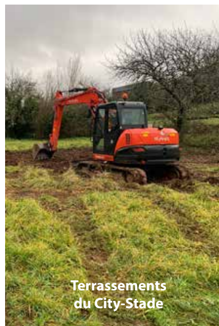
Terrassements du City-Stade