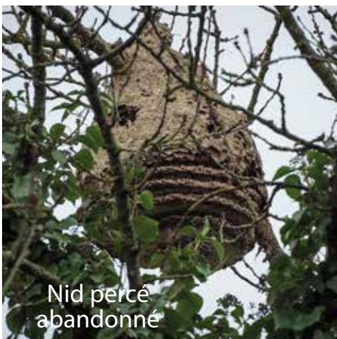
Nid percé abandonné

Que faire en cas de découverte d'un nid de frelon asiatique ?