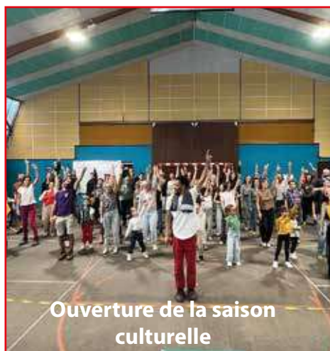
Ouverture de la saison culturelle