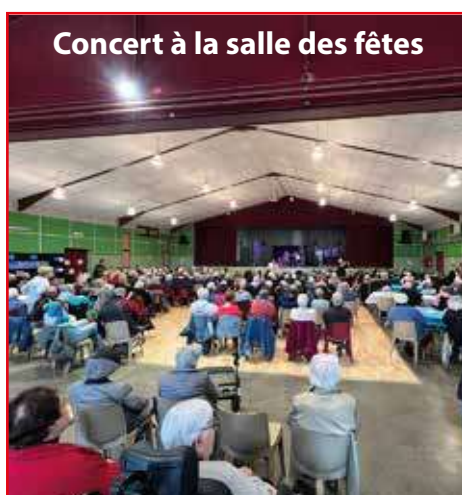
Concert à la salle des fêtes