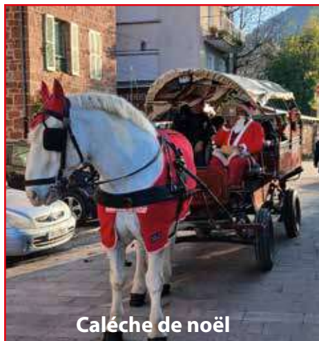
Calèche de Noël