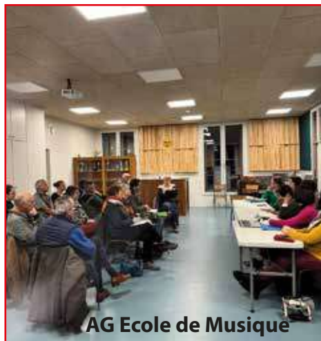
AG Ecole de Musique