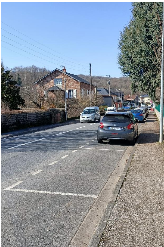
Vue de l'avenue Gustave Bessières vers la sortie de ville