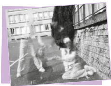
PHOTO ARGENTIQUE PORTRAIT À L'AFGHAN BOX DÈS 8 ANS

Cet atelier éveillera les enfants à l'univers fascinant du son au cinéma. Il leur permettra d'affiner leur sens de l'écoute et leur capacité à associer des sons à des images. Ils s'amuseront à découvrir comment des objets simples peuvent imiter des bruits du quotidien ou créer des effets sonores inédits, variés et parfois surprenants.